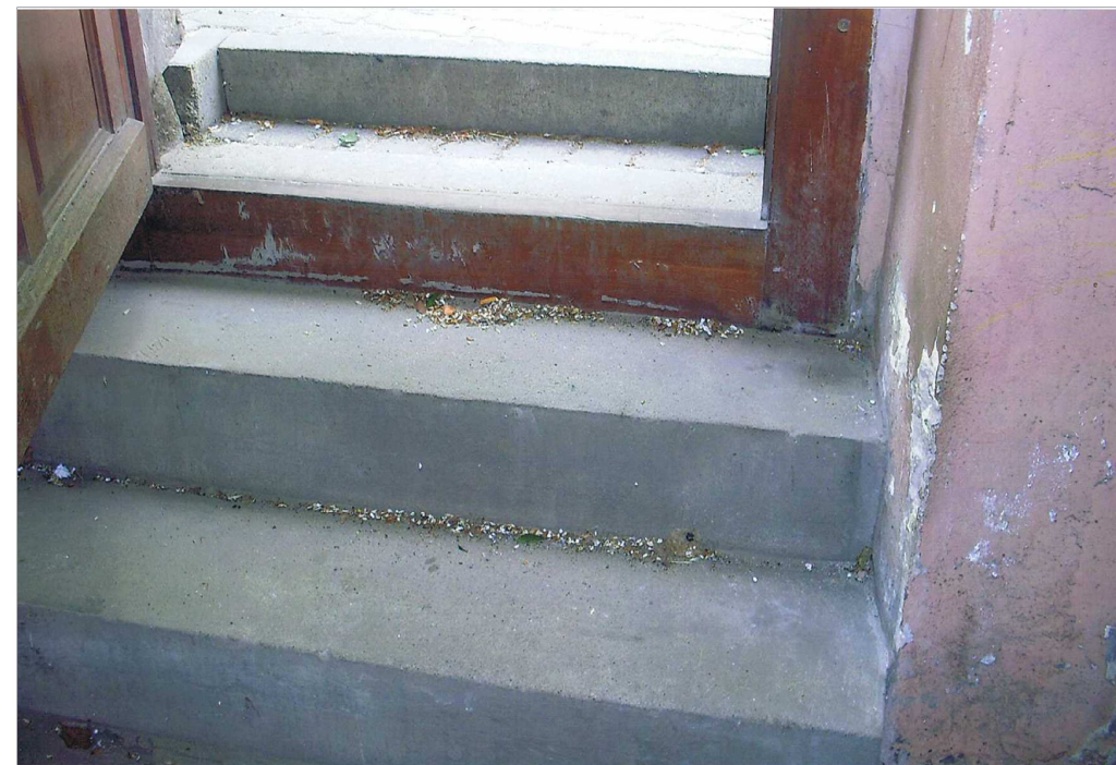
\triangle \circ 2